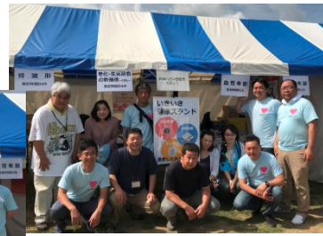
土・日にもかかわらず、多くの社員にご協力いただきました

2019年5月18日、19日の2日間、佐倉市ユウカリが丘南公園にて、佐倉産業まつりが開催されました。