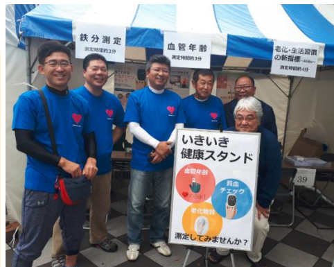
イベントに興味のある方、ご連絡お待ちしております。

今回使用した機器【アストリム（鉄分測定）・iハート（血管年齢）・AGEsセンサ】は貸出し（有料）を行っております。